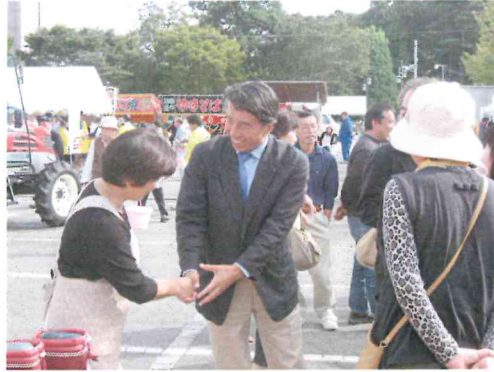
皆様と共に・・・

で身内をかばうようなことは絶対にしてはなりません。そして何よりも大事なことは、官との関係を律するためにも、政治家の方も、官になめられないだけの力量をつけなければなりません。 第三に、日々、地元で多くの方々とお会いしておりますと、今の自民党は、国民の感覚からずれていると思えてならないことがあります。自由民主党が、今一度、「国民の皆様と共に」という原点に立ち戻り、国民の皆様の気持ちの中に入っていけば、明日はありませぬ。