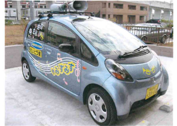
野田・流山・松戸の“すみずみ”まで走る！

で身内をかばうようなことは絶対にしてはなりません。そして何よりも大事なことは、官との関係を律するためにも、政治家の方も、官になめられないだけの力量をつけなければなりません。 第三に、日々、地元で多くの方々とお会いしておりますと、今の自民党は、国民の感覚からずれていると思えてならないことがあります。自由民主党が、今一度、「国民の皆様と共に」という原点に立ち戻り、国民の皆様の気持ちの中に入っていけば、明日はありませぬ。