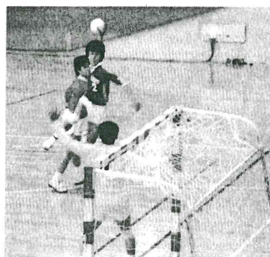
ハンドボールに明け暮れた学生時代