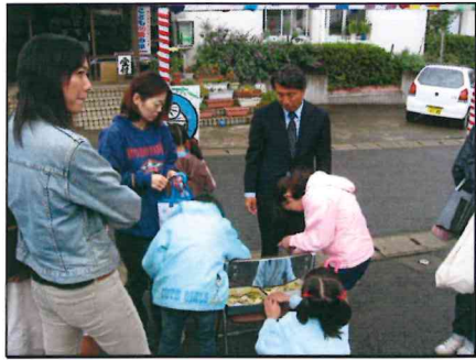
常にコミュニケーションを大切にしています