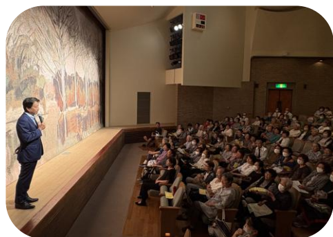
日本舞踊の会にて挨拶。着物や小道具にも伝統が感じられます。