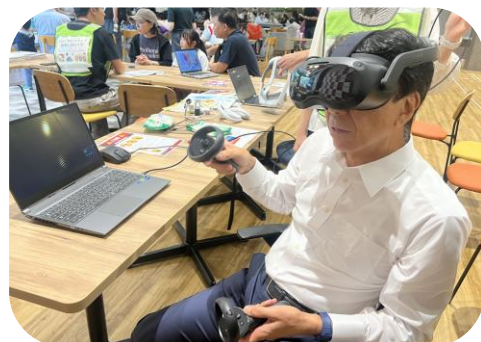
VRで災害時の避難を体験。