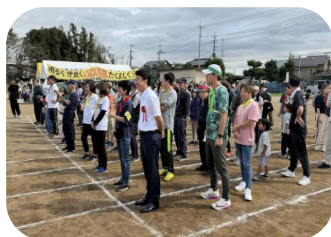
地域の運動会に飛び入り参加。明るく・仲良く・たくましく♪