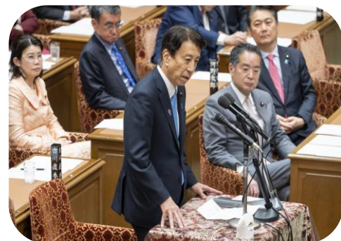
予算委員会筆頭理事として野党の 意見も取り入れ、物価高対策に尽力。