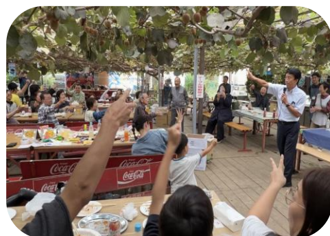
久し振りに出ました「じゃんけんぽん」あれからもう19年なんですね！