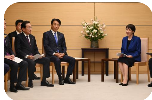
高市総理に脱炭素推進を提言。 経済成長との両立を図ります。

日本の経済界からの期待も大変大きく、この度の議員連盟総会では、経団連から、AZEC首脳会合(10月26日開催)に向け、(裏面へ続く)