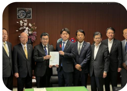
地下鉄8号線(有楽町線)の野田市までの延伸を国土交通大臣に陳情。

何よりも今は物価対策です。暮らしのご負担を少しでも軽くするために、ガソリン税等の暫定税率の廃止や補正予算の成立に向けて全力で取り組んでまいります。