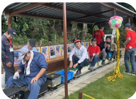
「前ヶ崎里山駅」が誕生☆本物の蒸気機関が迫力満点！出発、進行～！