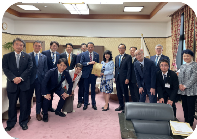
令和8年4月14日 財務大臣室にて

TXの東京駅延伸については、平成28年及び令和3年の交通政策審議会の答申において、都心部・臨海地域地下鉄(りんかい線及び羽田空港アクセス線と連携し、羽田空港に接続する路線)と一体的に整備することを検討すると明記され、このうち都心部・臨海地域地下鉄については令和5年、東京都が整備主体及び事業主体を発表し、令和22年の開業を目指すこととされました。(裏面に続く)