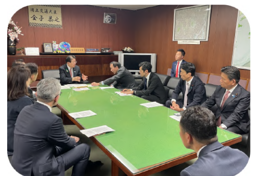
令和8年4月15日 国土交通大臣室にて