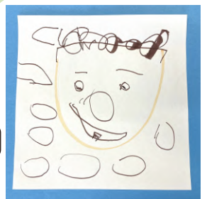
5歳の子がご主人の似顔絵を届けてくれたワン!

関係府省庁、医療・学術界、企業、自治体、市民社会と連携しながら、同僚議員とともに具体的な前進をこの議連で実現していきたいと思っています。